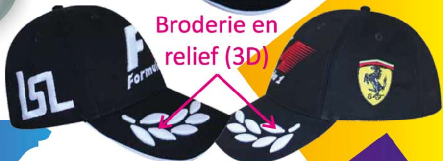
Broderie en relief (3D)